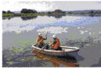
宮島沼での調査活動

位置: 北緯43度20分、東経141度43分 / 標高: 13m / 面積: 41ha / 湿地のタイプ: 淡水湖 / 保護の制度: 国指定鳥獣保護区特別保護地区 / 所在地: 北海道美瑛市 / 登録: 2002年11月