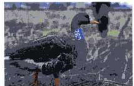
標識をつけたマガン