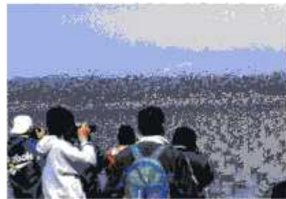
湖面を埋めつくすマガン